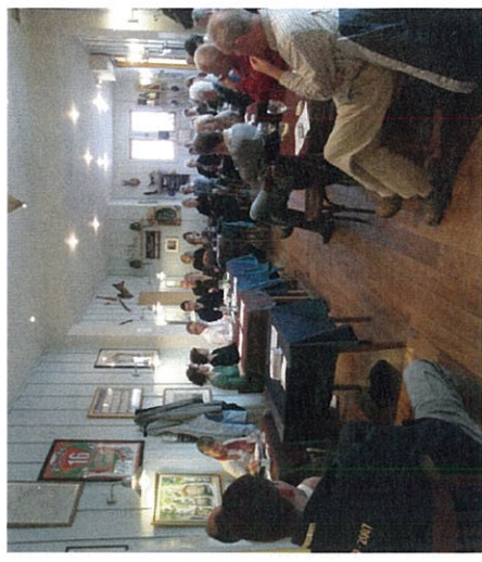
Lieu des débats : Le Restaurant La Villa Sud-Ouest

« Pour ceux qui pensent que l'économie ne doit pas rester une affaire de spécialistes »